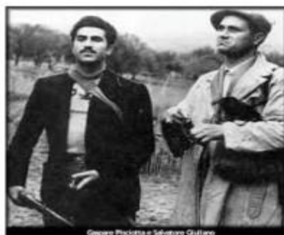
Giuseppe Picciotto e Salvatore Giuliano

minciano a sentire gli effetti: non più mafia, ma mafie, piccole mafie, tante, ovunque e di ogni tipo. E non è stata un'autobomba a far prendere coscienza di ciò al popolo italiano, ma una testata; anzi, una capocciata, visto che il tutto è accaduto a Ostia, un quartiere (si fa per dire) di Roma.